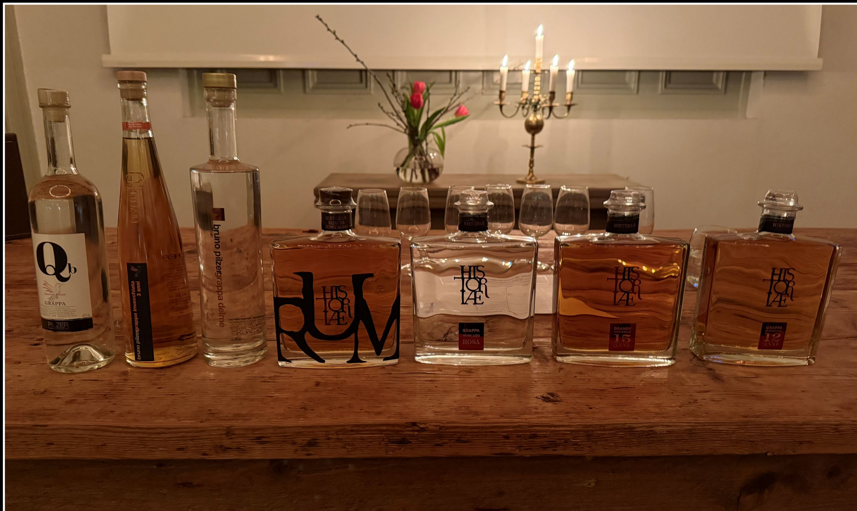
Kvällens drycker i provningordning, från vänster till höger