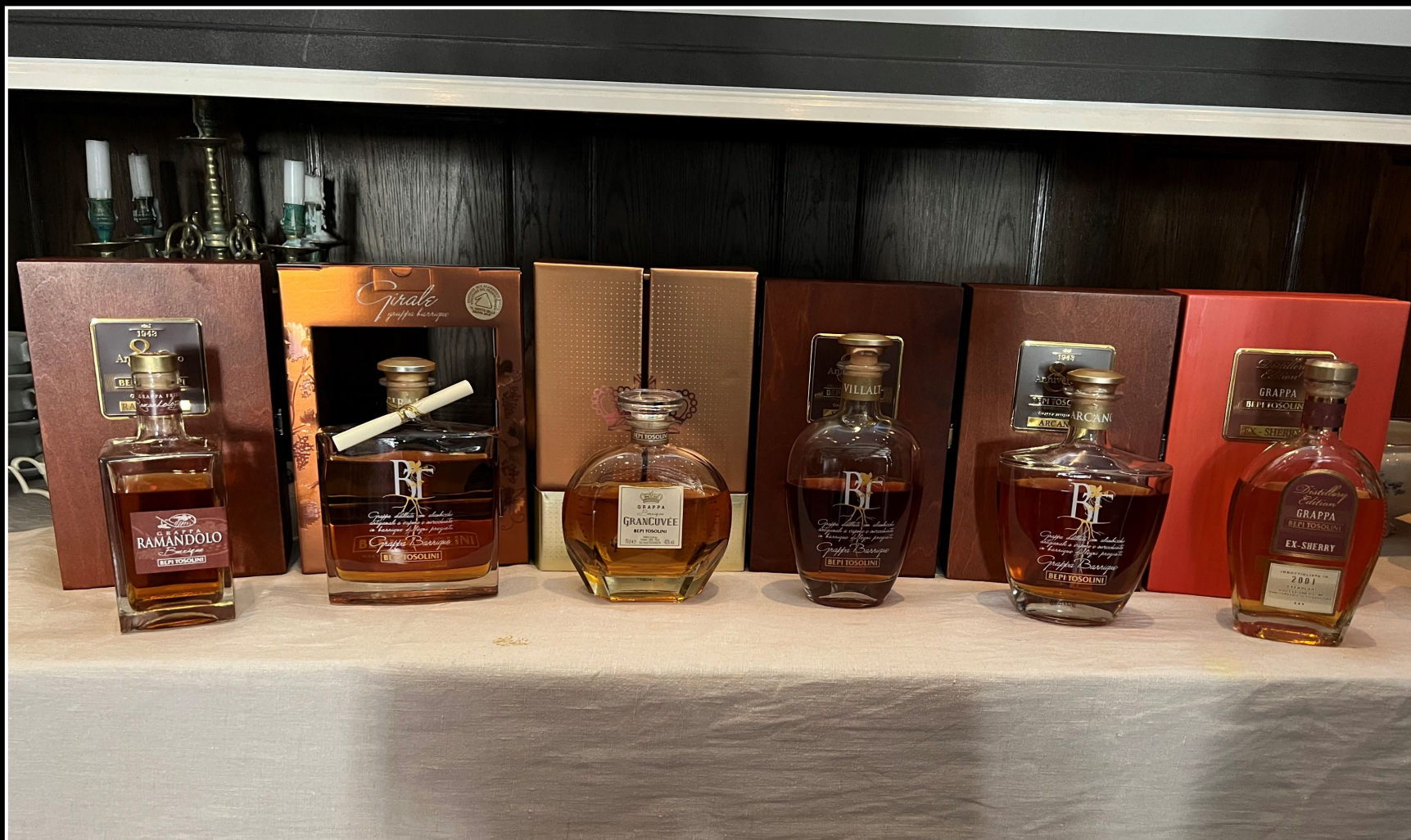
Kvällens grappa, provningsordning från vänster