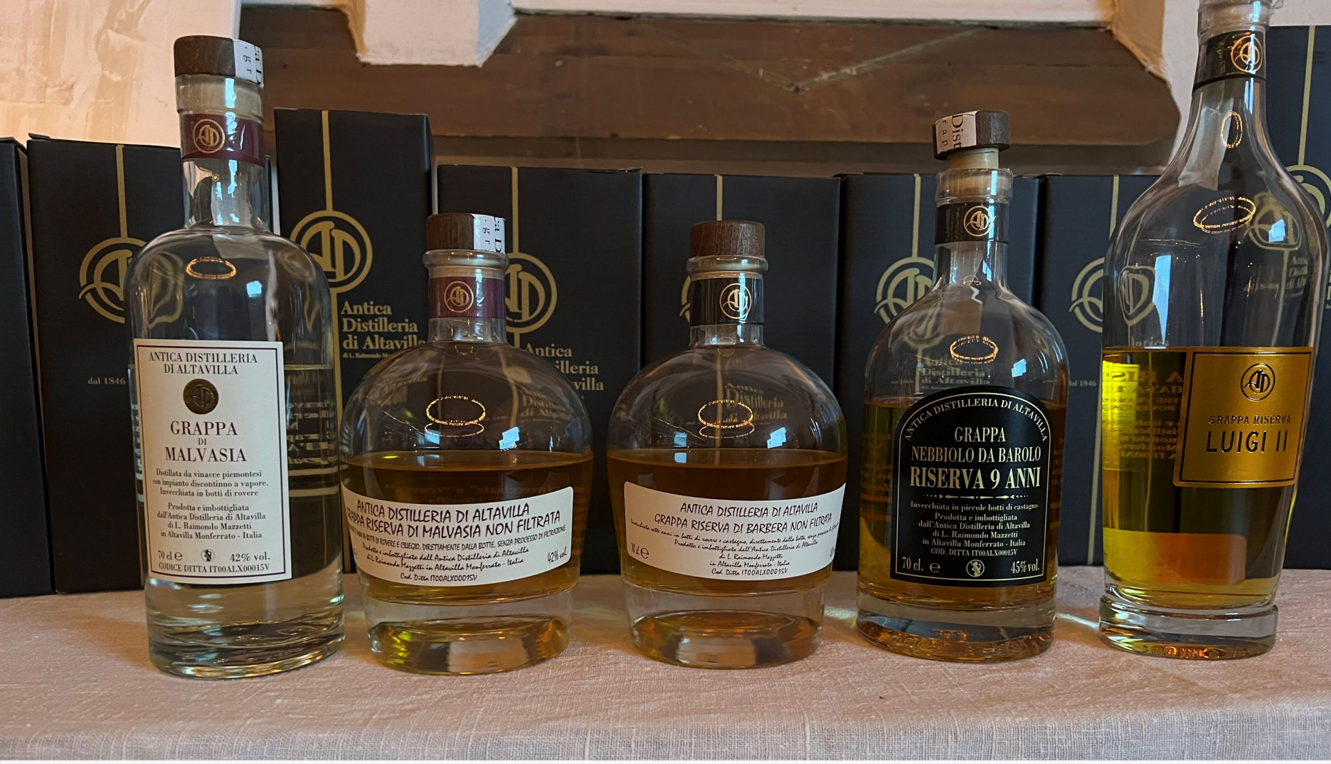
Kvällens grappa, provningsordning från vänster