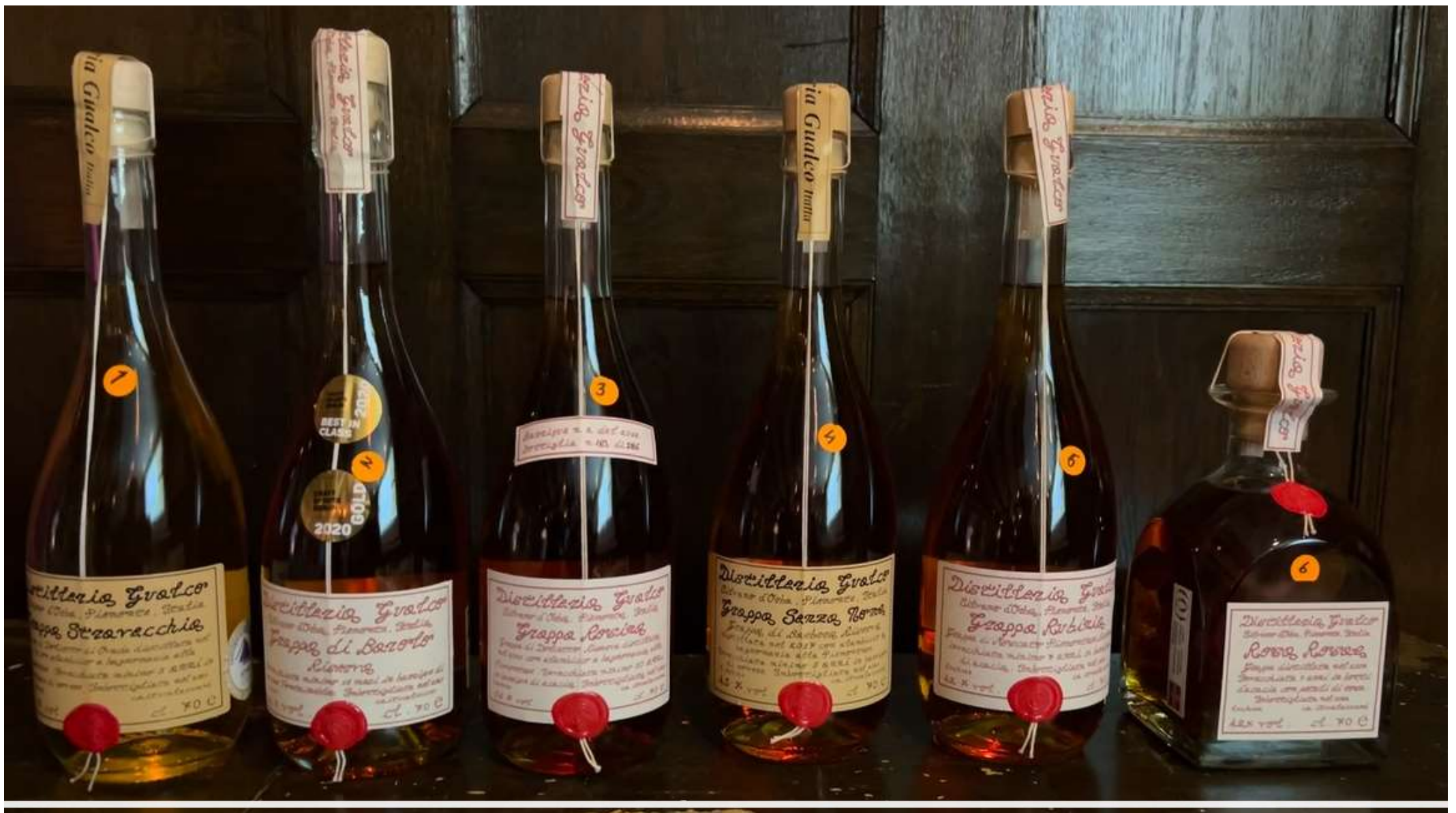
Kvällens grappa, provningsordning från vänster