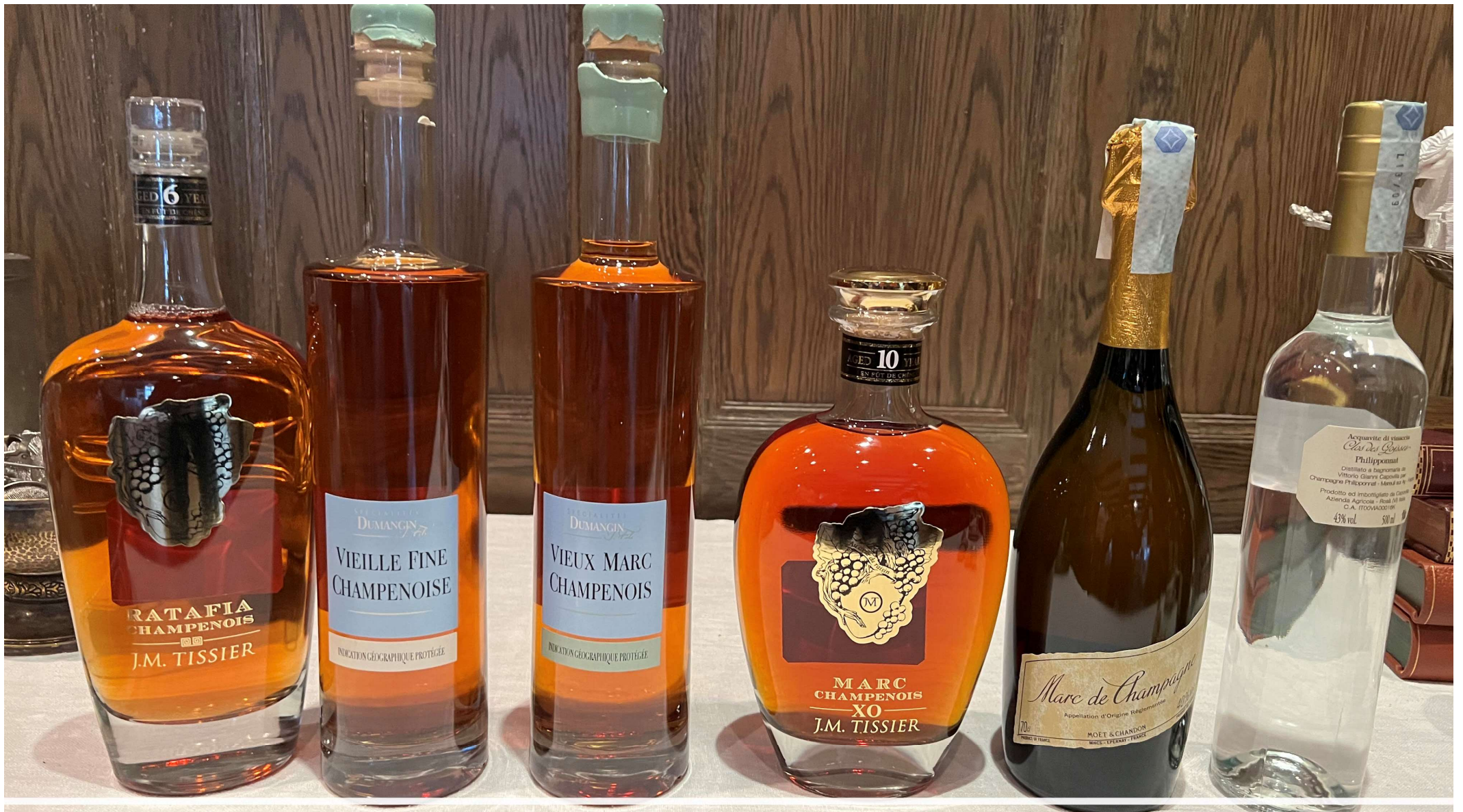
Kvällens marc, provningsordning från vänster