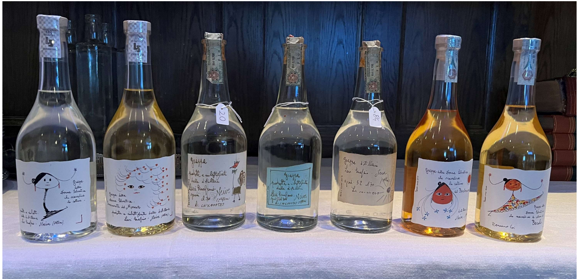
Kvällens grappa, provningsordning från vänster