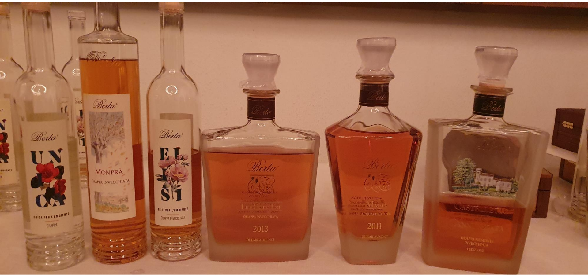
Kvällens grappa, provningsordning från vänster