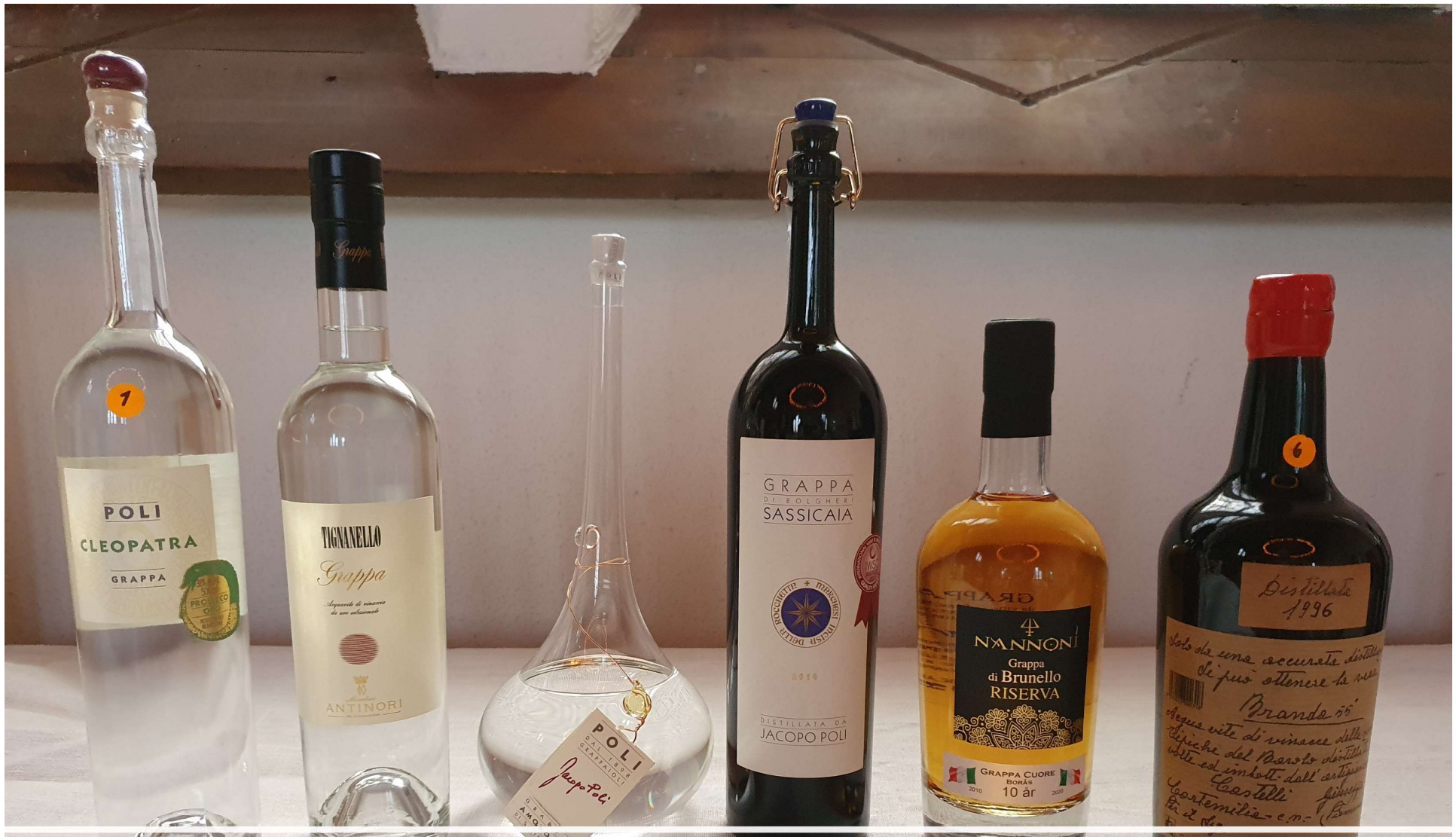
Kvällens grappa, provningsordning från vänster