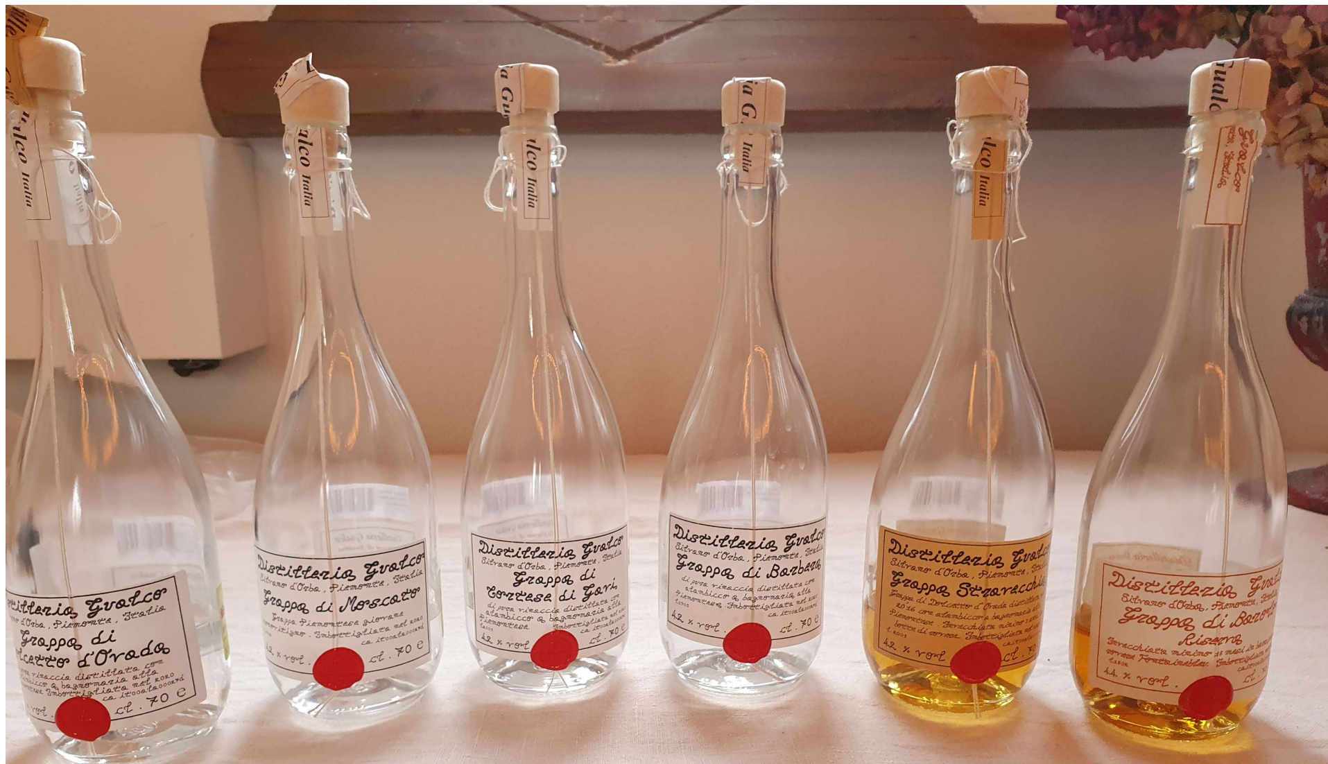
Kvällens grappa, provningsordning från vänster